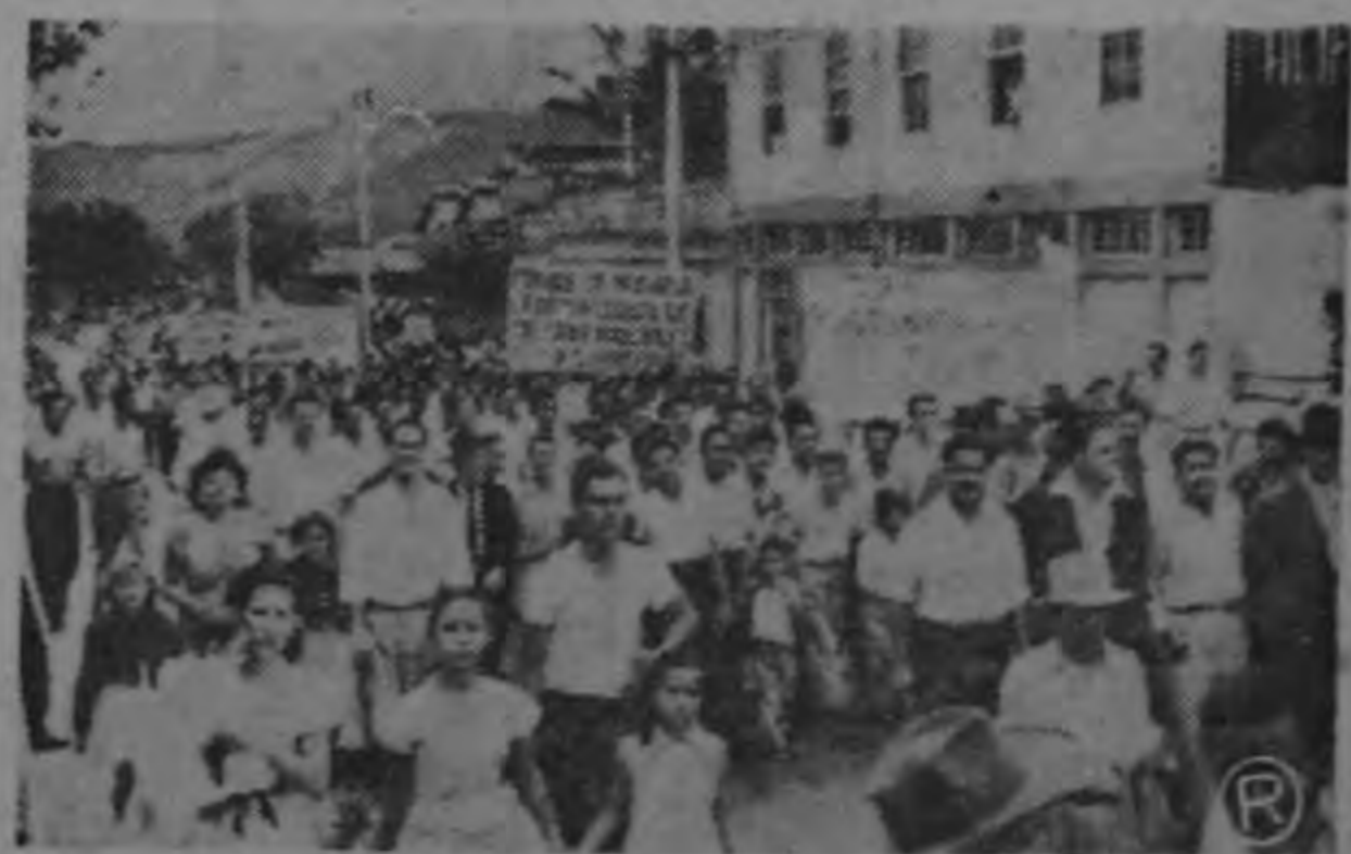
LOS "CAMARADAS" EL PRIMERO DE MAYO.—Los "camaradas", como era de esperarse, hicieron su desfile del primero de mayo. Igual que en otras oportunidades, cuatro gatos fueron los que desfilaron en un desnutrido grupo que se puede contar con los dedos de la mano.