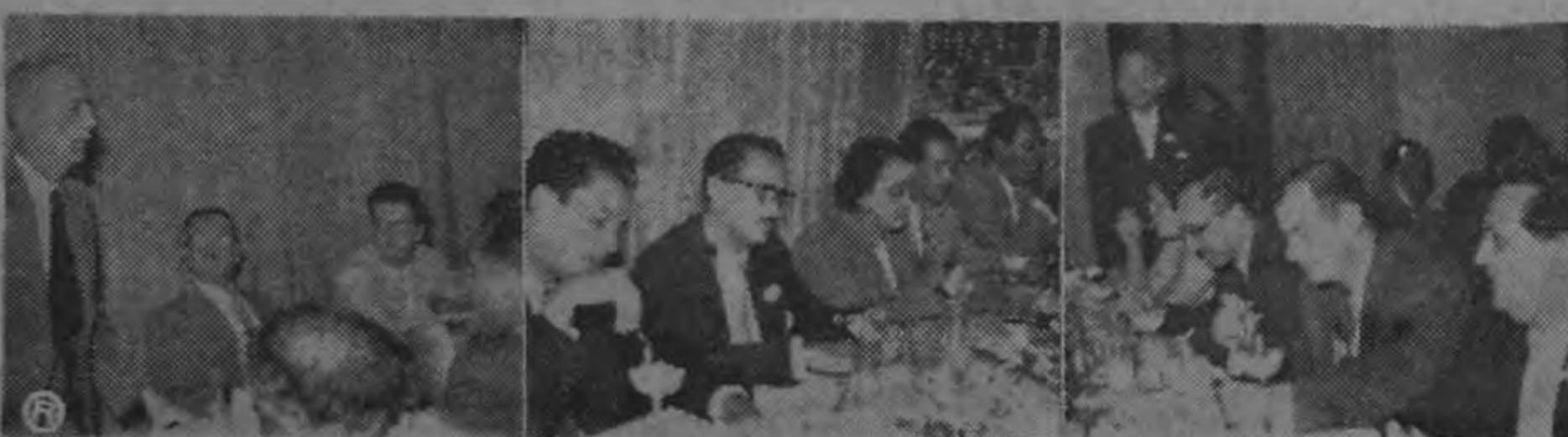
HOMENAJE AL LIC. FACIO.—La mayoría parlamentaria rindió sentido homenaje al Lic. Gonzalo J. Facio, quien cesó en sus funciones de Presidente de la Asamblea Legislativa. Apréciense en las fotos varios aspectos alusivos al acto.