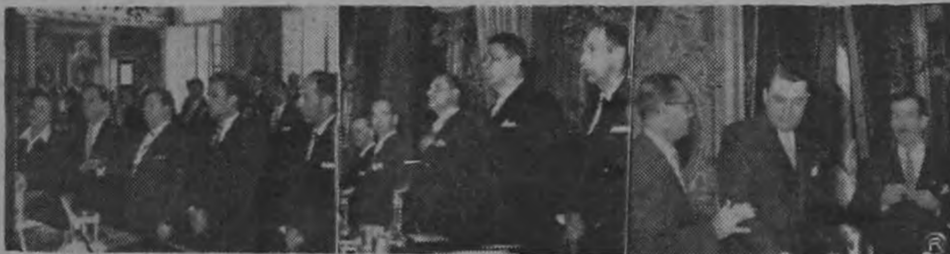
INSTALACION DEL NUEVO DIRECTORIO.—El 1º de Mayo, se instaló en la Asamblea Legislativa el nuevo Directorio parlamentario. Las fotos recogen varios aspectos de este acto, durante el cual el Presidente Figueres rindió su informe anual y los nuevos miembros del Directorio tomaron posesión de sus cargos.